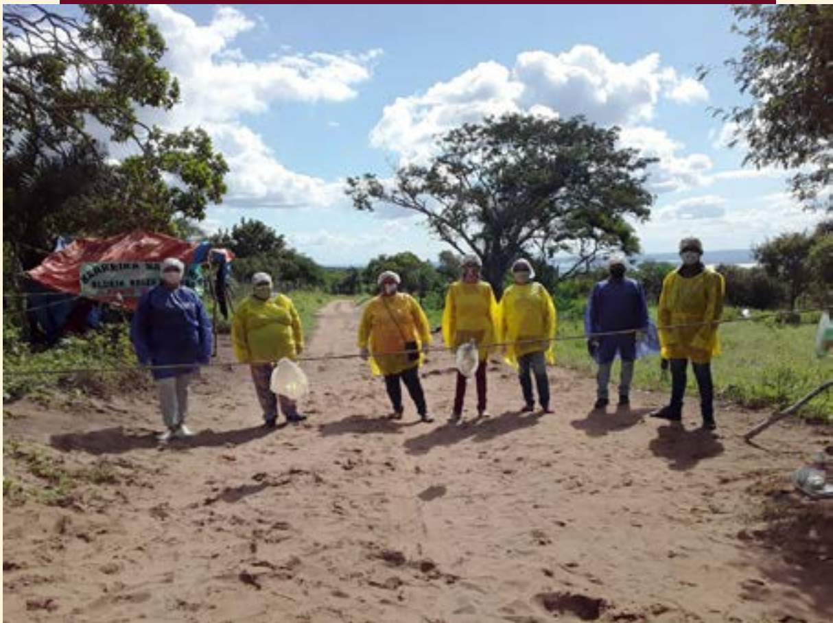
BARREIRA SANITÁRIA NA ALDEIA BAIXA DO LERO, POVO ENTRE SERRAS PANKARARU