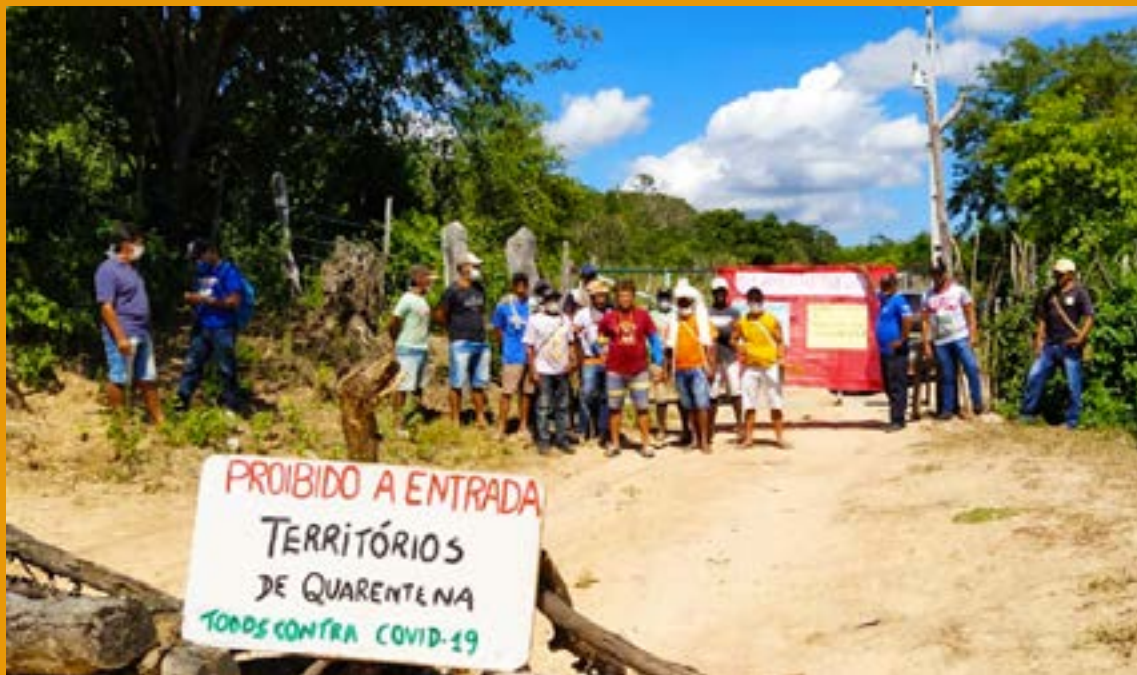
BARREIRA SANITÁRIA EM PANKARÁ DE ITACURUBA. ABRIL DE 2020.

Atentando aos cuidados necessários para evitar a transmissão da doença infectocontagiosa, a coleta das informações foi pensada para contextos de distanciamento. A forma encontrada pela equipe foi o uso da internet para coleta de informações. Compreendemos que este meio, por si, já definiria um perfil limitado de participantes, que necessitariam ter acesso a equipamentos digitais, a exemplo de smartphones ou computadores, e certa familiaridade com o meio virtual para responderem. Na análise das respostas, percebemos de forma mais detalhada esse perfil, formado