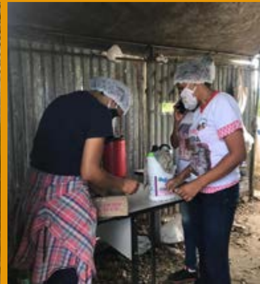
BARREIRA SANITÁRIA NA ALDEIA CAXIADO, POVO PANKARARU