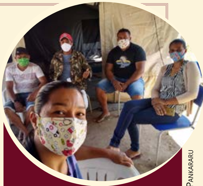
ALDEIA CAXIADO, POVO PANKARARU

» HOUVE UM NÚMERO EXPRESSIVO DE PESSOAS QUE INFORMARAM O USO DE MÁSCARAS DE TECIDO COMO EPI (84,4%), EMBORA HAJA QUESTIONAMENTOS SOBRE A EFICIÊNCIA DESTA PROTEÇÃO PARA PROFISSIONAIS DA SAÚDE, QUE, POR VEZES, TÊM DE LIDAR DIRETAMENTE COM PESSOAS INFECTADAS.